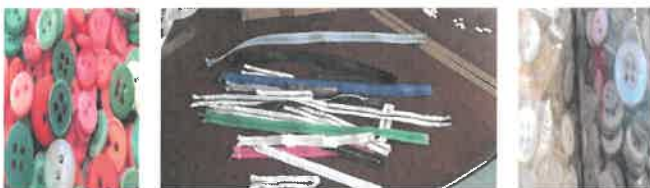
Récupération de boutons et tirettes