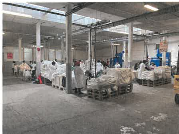
Passage de 16 à 20 postes de coupe à l'automne grâce au soutien de notre client