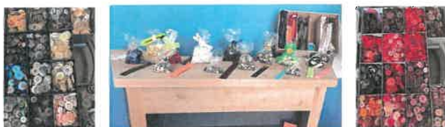
Récupération de boutons et t Brettes