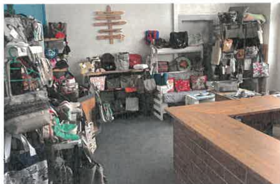
Quelques articles réalisés par nos couturières et couturier à partir de boutons, fermetures éclairs, tissu de récupération d'entreprises partenaires

Le nombre de femmes embauchées a représenté près du double de la part des hommes.