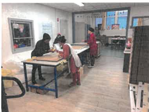
Travaux de sous-traitance