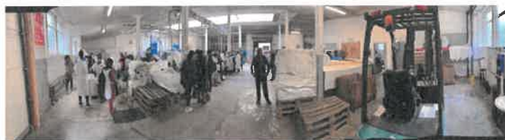
Vision d'ensemble du local principal de travail du Chantier d'insertion

Les activités support d'espaces verts, d'entretien des locaux, de second œuvre en bâtiment comme de recyclage d'objets divers récupérés permettent aux encadrants techniques de réaliser des actions en direction de clients qui vont contribuer financièrement à équilibrer le budget de la structure. Elles sont particulièrement utiles pour faire découvrir aux salariés des métiers avec leurs particularités et les perspectives d'emploi dans la région. Ces temps collectifs amènent à se confronter à des situations nouvelles pour certains et ainsi à comprendre et intégrer les codes sociaux et professionnels français.