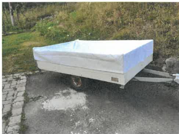
Autres travaux de sous-traitance : couture de sacs, trousses, chaussons, bâches à partir de récupération