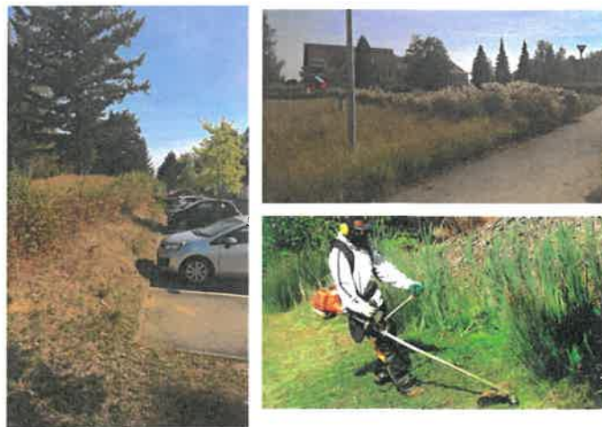
Travaux d'espaces verts : pistes cyclables, espaces collectifs

C'est entre autres dû à une succession d'arrêts maladie relativement longs d'un encadrant technique chargé des espaces verts et d'une autre attachés à l'atelier de la sous-traitance.