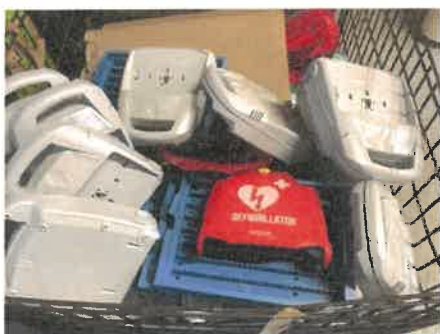
Travaux de sous-traitance : plasturgie - contrôle, assemblage et récupération des erreurs, défauts pour réutilisation partielle

Les travaux de sous-traitance ont toujours porté sur de la transformation de tissu en chiffon industriel par plus de trente salariés, mais aussi sur des actions de contrôle, d'assemblage, d'étiquetage, et de conditionnement de matériels pour différents clients alsaciens occupant une dizaine de salariés, ainsi que sur des interventions dans le domaine de la couture pour une demi-douzaine de salariés.