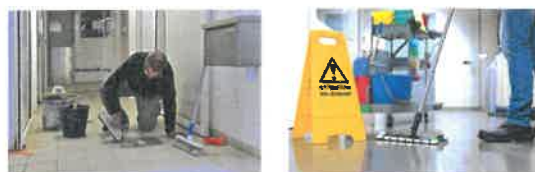
Tâches de rénovation et de nettoyage

Avec le soutien de partenaires publics, de collectivités territoriales, d'associations et d'entreprises